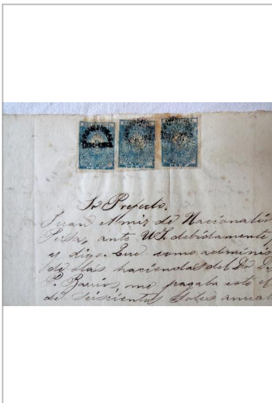
Imágen: Timbres, 1er folio recto.