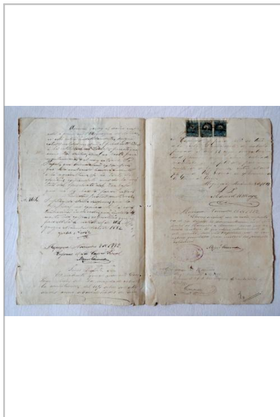
Imágen: Bifolio, cara interna