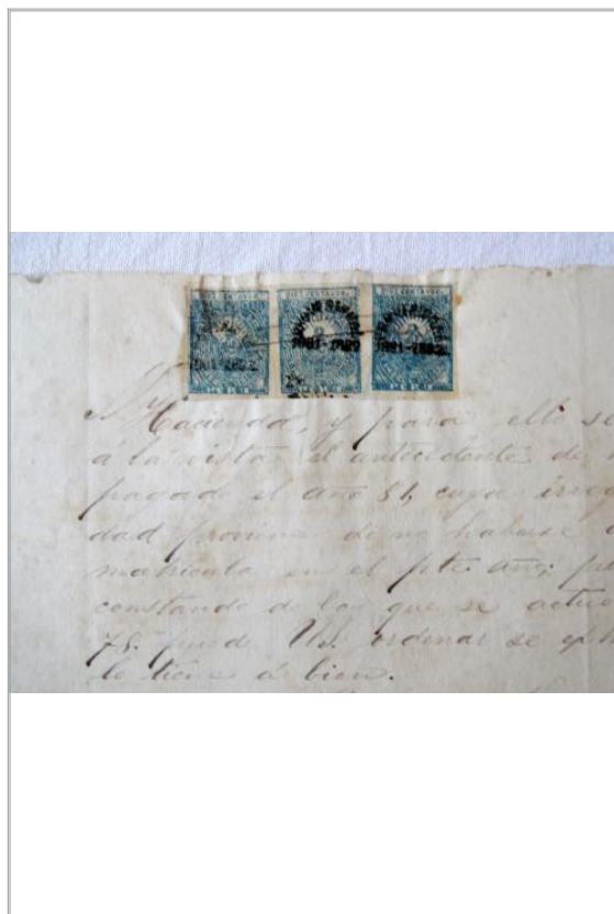
Imágen: Timbres, 2do folio recto.